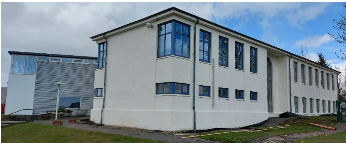
Mynd: Leikskólinn Leikholt, Brautarholti

Efni: Leikskólinn Leikholt Brautarholti. Minnisblað um sýnatökur 31.05.2021