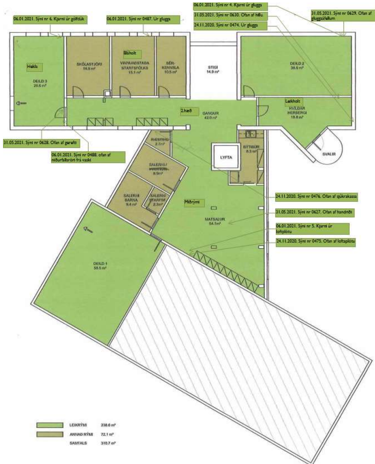
Grunnmynd 2. hæð