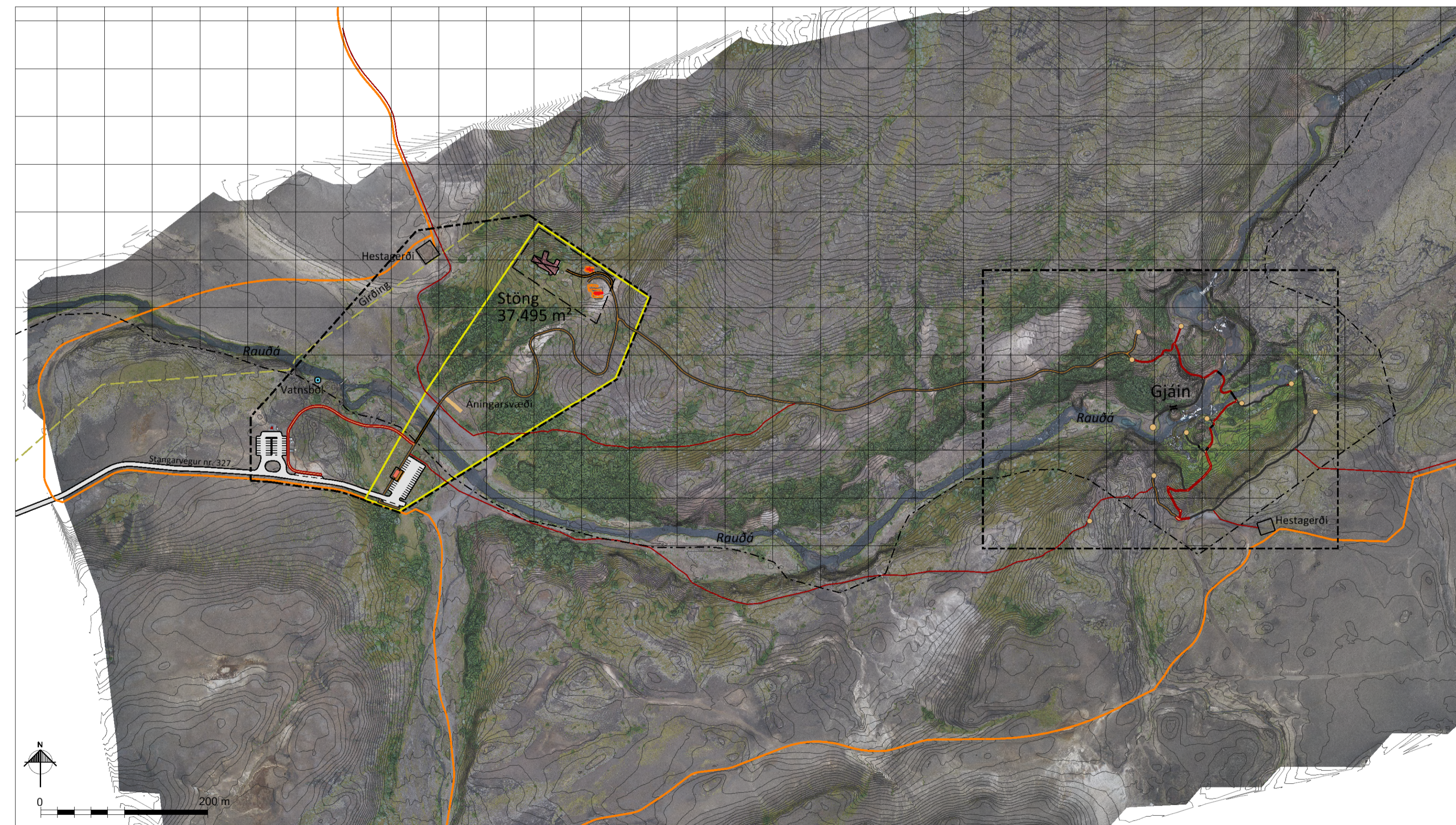
Skýringaruppráttur í mkv. 1:3.500.

SKIPULAGSFERLI Deiliskipulagstillagan var kynnt _____ með athugasemdafresti til _____ Deiliskipulagstillagan var auglýst frá _____ með athugasemdafresti til _____ Auglýsing um gildistöku deiliskipulagsins var birt í B deild Stjórnartíðinda _____