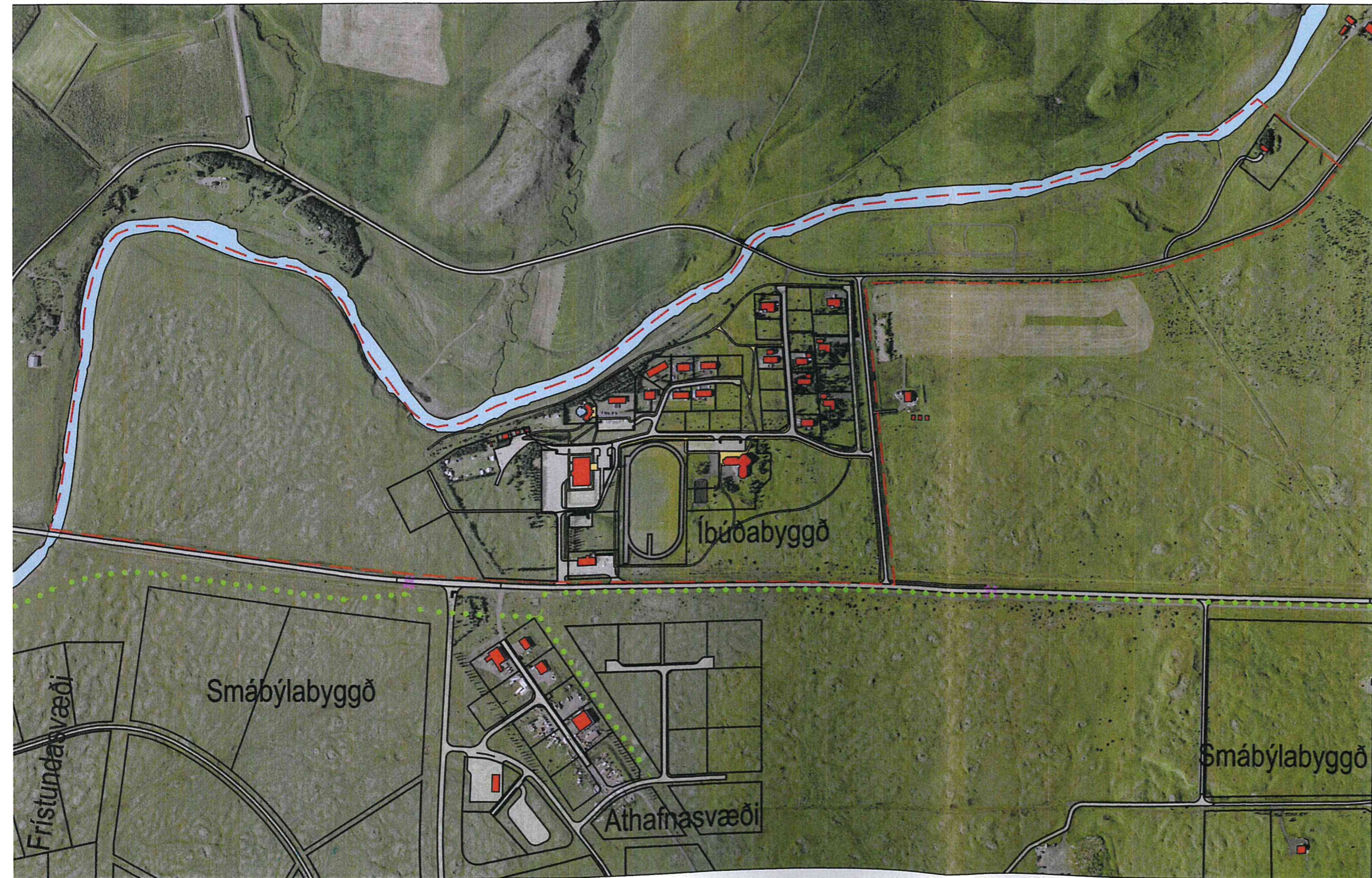
Yfirlitsmynd - ekki í kvarða