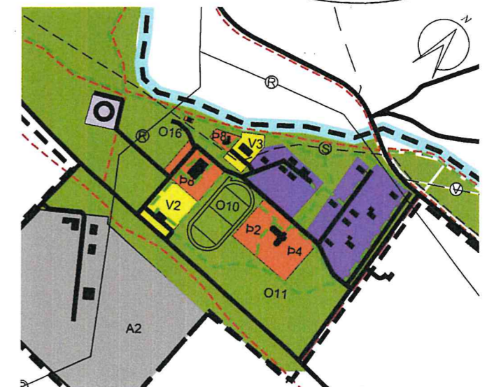
Aðalskipulag þéttbýlisuppdráttur fyrir Árnes 2004-2016 e.br. ekki í kvarða

undirskrift skipulagsfulltrúa frá 2019 og Gnúpverjahrepps