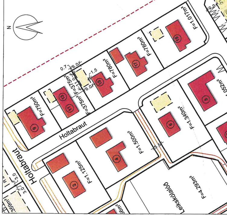
Deiliskipulag eftir breytingu - mkv. 1:1.000

Deiliskipulagsbreyting þessi sem gremndarkynnt hefur verið skv. 2. mgr. 43. gr. skipulagslaga nr. 123/2010 m.s.br. var samþykkt í sveitastjórn Skeiða- og Gnúpverjahrepps þann