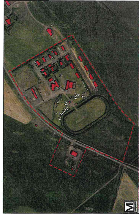
Yfirlitsmynd - ekki í kvörða

Uppdráttur þessi er teiknaður í hnitkerfinu ISN83 og byggir á uppréttri lögmund frá Landmýndum ehf.