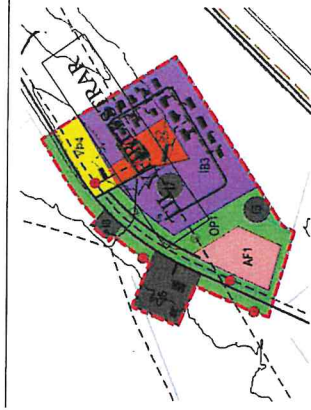
Úr aðalskipulagi Skeiða- og Gnúpverjahrepps 2017 - 2029

Samþykkt deiliskipulagsbreytingarinnar var auglýst í B-deild Stjórnartíðinda þann