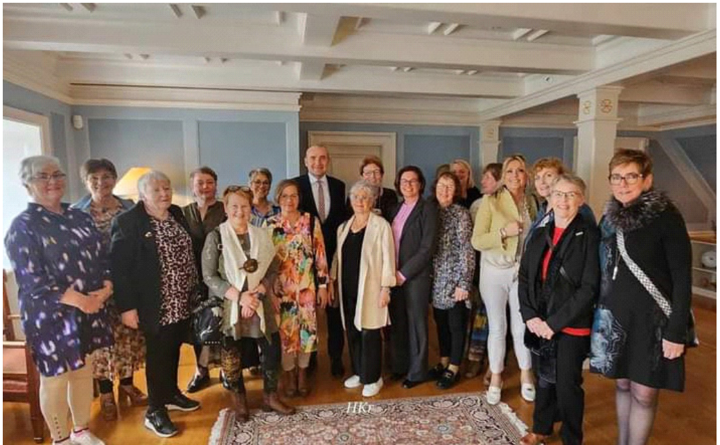
Guðni forseti heilsaði líka upp á kvenfélagskonurnar