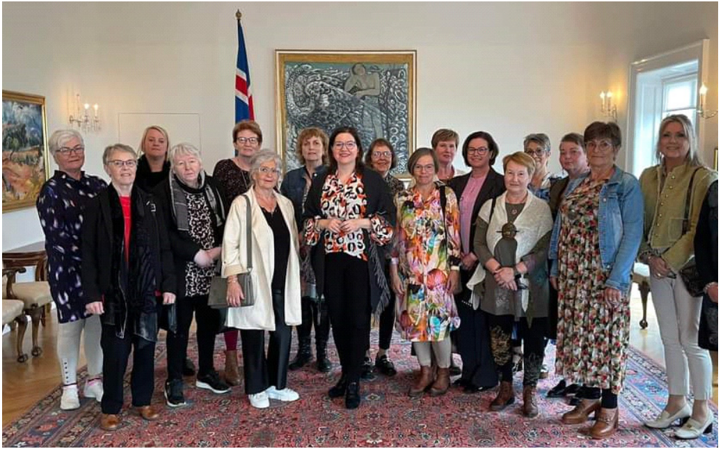
Á Bessastöðum 2.mai 2024 með Frú Elisú Reid